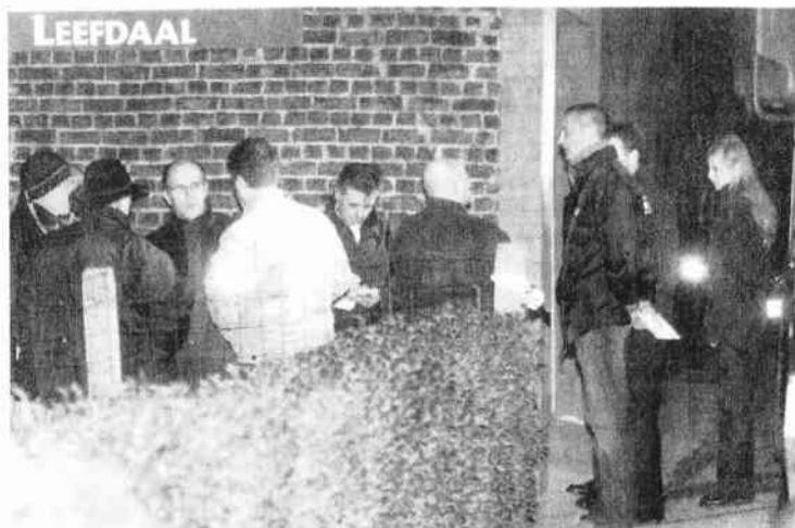
Politie en het parket zakten gisteren af naar de Kruisstraat.